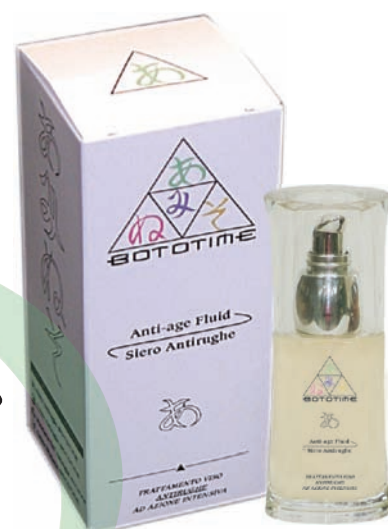
Anti-age Fluid Siero Antirughe 30 ml e

Delicata crema arricchita di sostanze naturali e di principi attivi ad alto potere antirughe ed idratante specifico per piccole rughe di espressione.