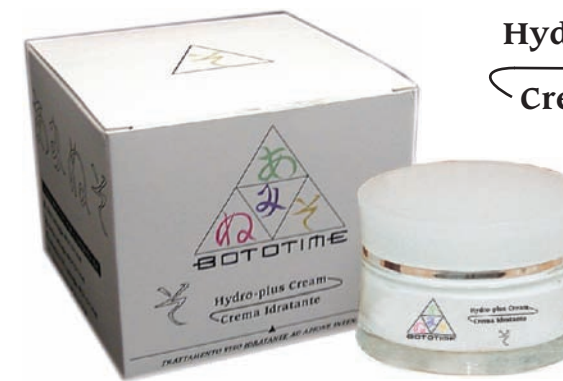
Hydro-plus Cream Crema Idratante 50 ml e

Morbida crema che, grazie alla presenza di principi attivi naturali titolati, è particolarmente indicata per la prevenzione ed attenuazione delle rughe di espressione.