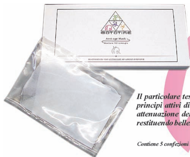
Anti-age Mask Maschera TNT Antirughe

Il particolare tessuto inerte è stato imbevuto di morbido gel ricco in principi attivi di origine naturale che agiscono sulla prevenzione ed attenuazione delle rughe di espressione. La zona trattata si rilassa restituendo bellezza ed armonia al volto.