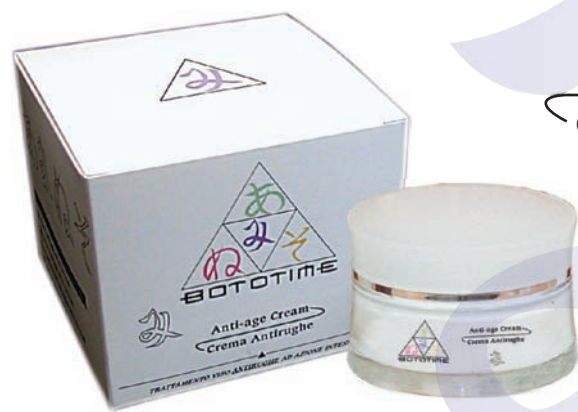
Anti-age Cream Crema Antirughe 50 ml e

Morbida crema che, grazie alla presenza di principi attivi naturali titolati, è particolarmente indicata per la prevenzione ed attenuazione delle rughe di espressione.